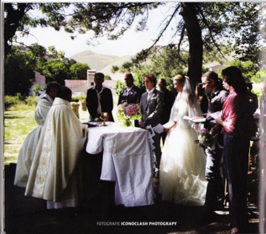
FOTOGRAFIE ICONOCLASH PHOTOGRAPY